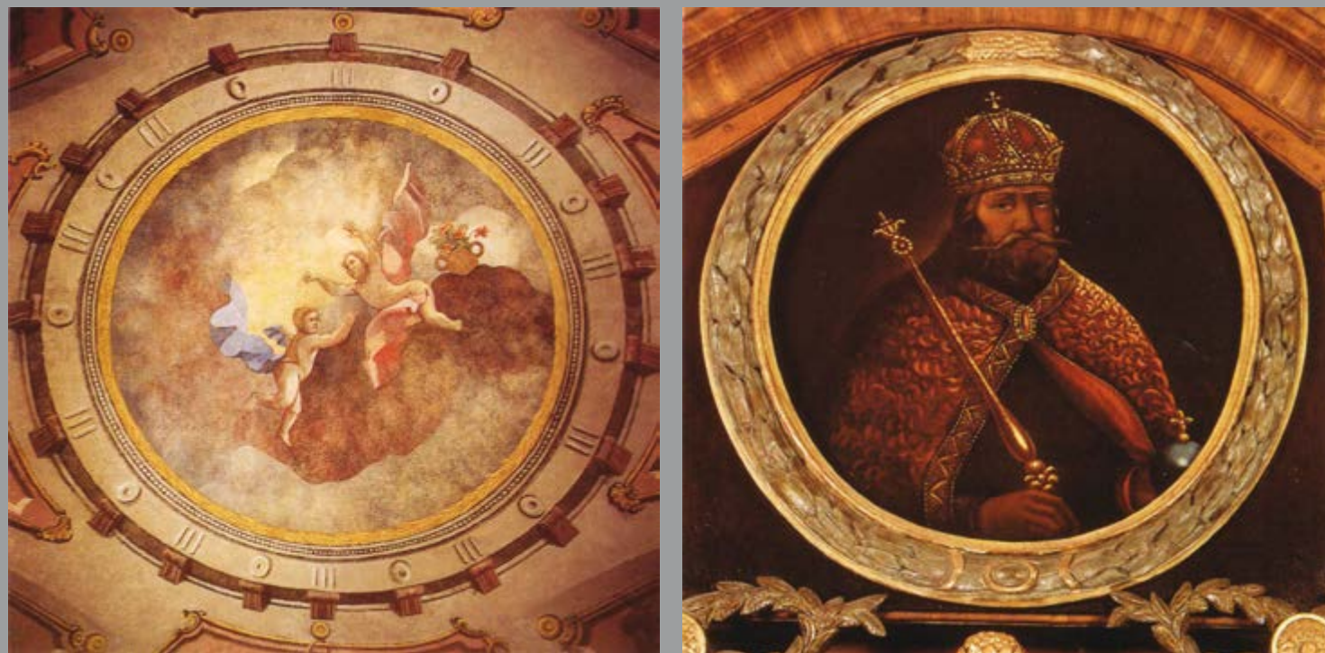
Kiosego (Koszeg) vaistinių officinų interjerai (1777-1842).

(iš knygos „Apotheken-Museen-Denkmalapotheken in Ungarn“, 1996)