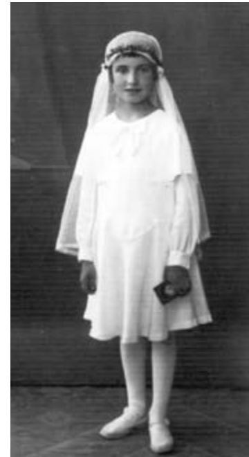
Pirmosios Komunijos atmintis, 1933 m.

Pirmaisiais metais dauguma paskaitų – chemija ir fizika, bei