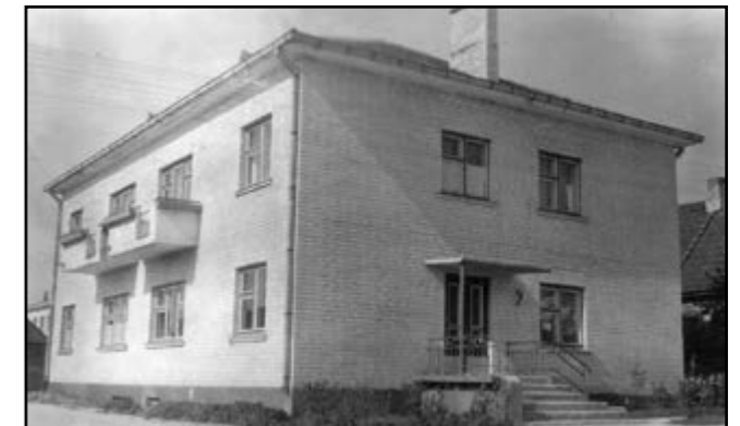
Ariogalos vaistinė 1961 m. persikėlė į naujas erdvias patalpas.