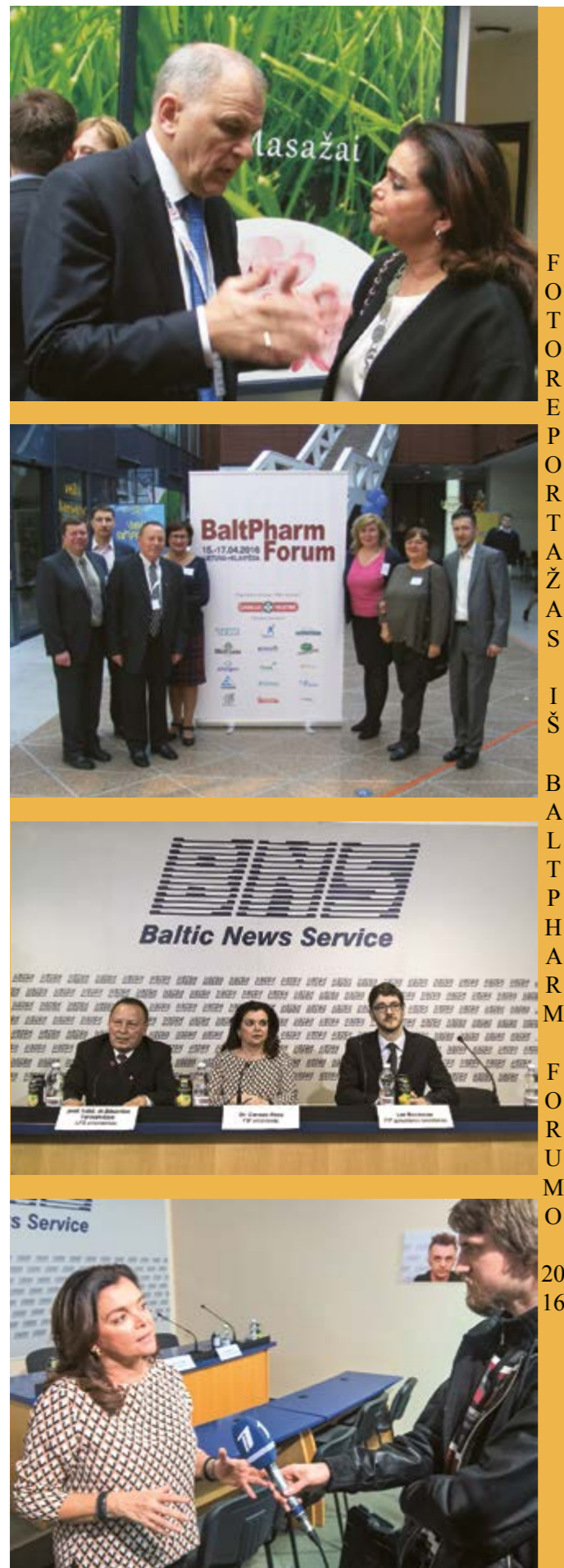
FOTOREPORTAŽAS IŠ BALT PHARM FORUMO 2016