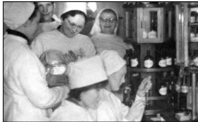
Ariogalos vaistinės asistentų kambaryje. 1966 m.

Apie Ariogalos vaistinės įstiegi 100-čio jubiliejų 1966. XII. 17 d. Raseinių rajono laikraštje „Naujas rytas“ buvo atspausdinti straipsniai: „Ariogalos vaistinės jubiliejus“ ir „Prieš šimtmetį atvėrė duris“. Laikraštis „Komjaunimo tiesa“ 1966. XII. 21 d. atspausdino straipsnį „Ariogalos vaistinei 100 metų“.