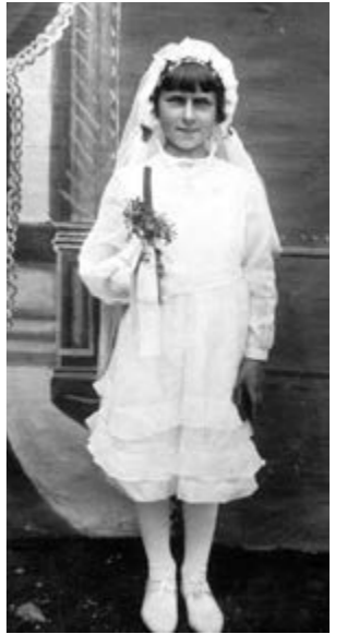
1-oji Komunija, 1937 m.