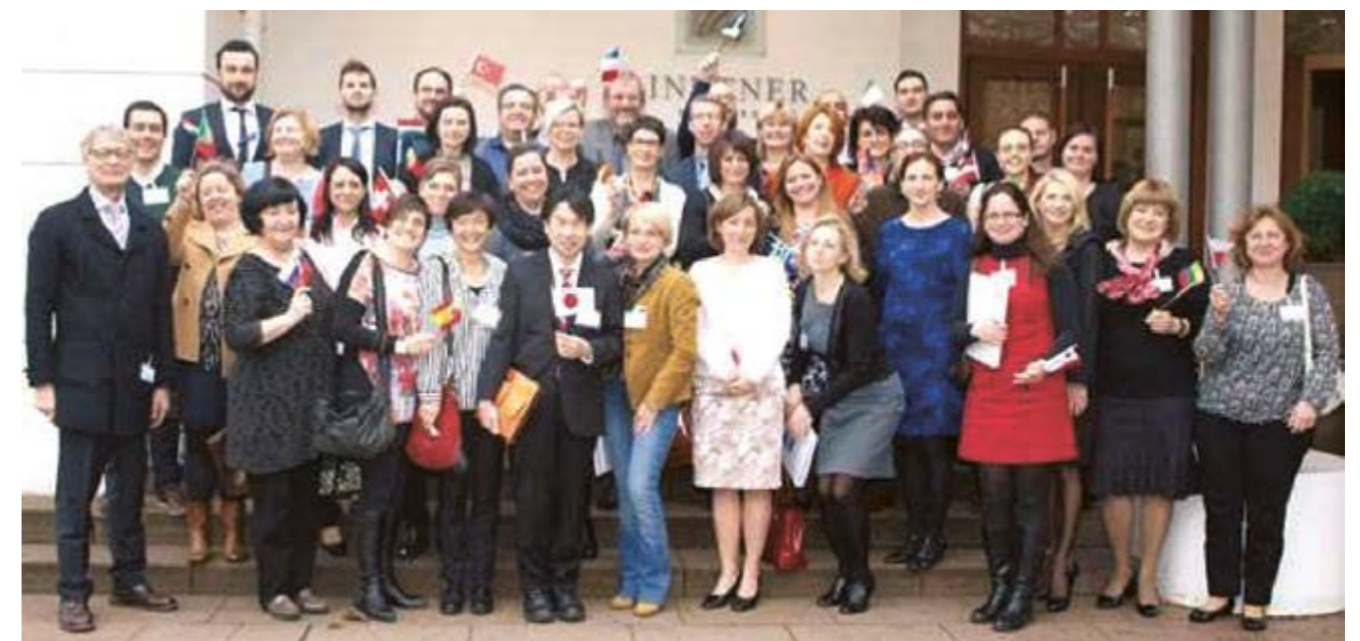
Europos onkologinės farmacijos sąjungos valdybos nariai ir šalių delegatai konferencijos Dubrovnike metu.