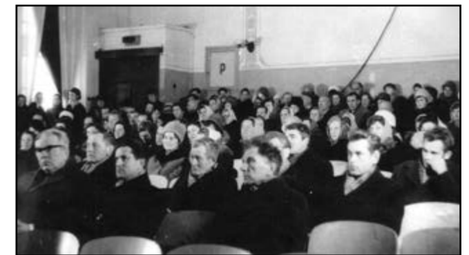
Ariogalos vaistinės šimtmečio minėjimo dalyviai kinoteatre „Dubisa“ salėje. 1966.12.17.

1966 m. gruodžio 17 d. iškilmingai buvo pažymėtas Ariogalos vaistinės įsteigimo 100-čio jubiliejus. Ta proga