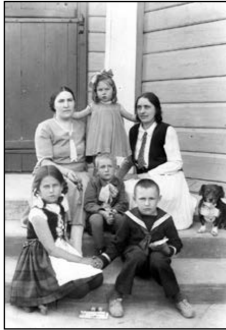
Prie Luokės bažnyčios, 1930 m.