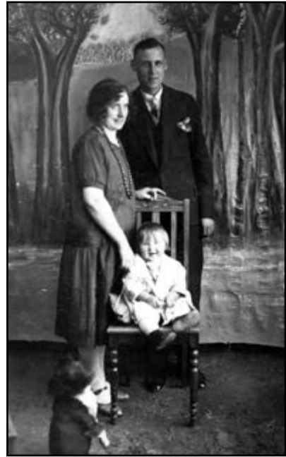
Su tėveliais ir Foksu, 1929 m.