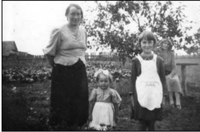
1937 m. Žarėnuose su mama ir sesute.

Šešto skyriaus mokslo metus pradėjome naujoje gražioje mokykloje. Tai buvo dviejų aukštų pastatas su sporto sale. Mokykloje buvo vandentiekis, tualetai, dušai, tai buvo neregėtos Luokėje naujovės. Mokykloje vaikščiujome su šlepetėmis.