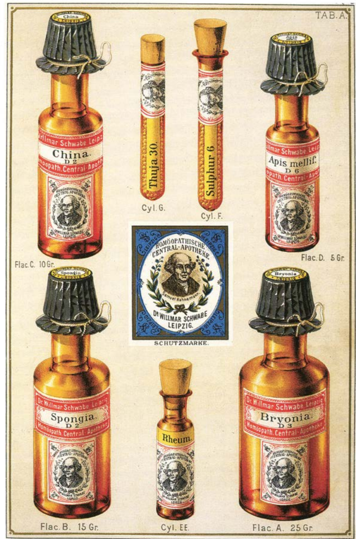
Leipcigo centrinės homeopatijos vaistinės homeopatiniai vaistai buteliukuose ir cilindriukuose. Centre homeopatijos pradininko Samuelio Hanemano portretas. Iš kn.: „Geschichte der Apotheke“, Kelnas.